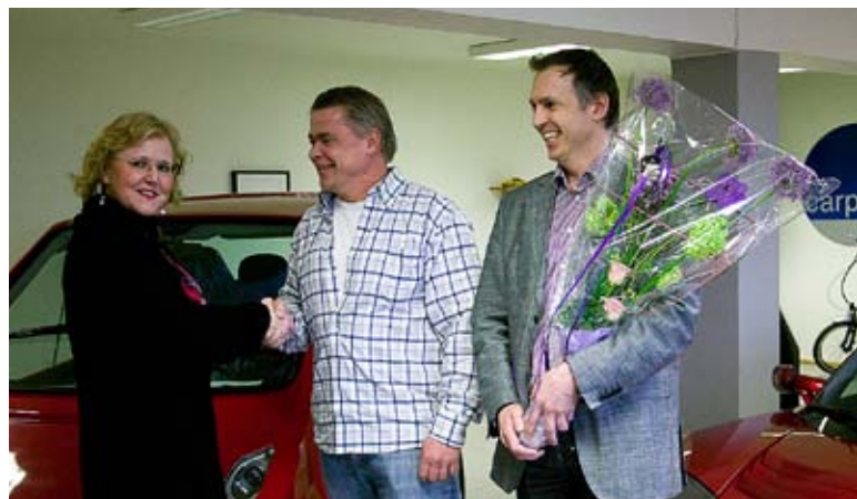
Carpoint ble medlem nummer 1.000 i 2011.

NiTs forretningsnettverk for kvinnelige ledere/nøkkelpersoner – GROnett – har hatt et meget høyt aktivitetsnivå i 2011. GROnett hadde 382 medlemmer ved utgangen av året og arrangerte totalt 16 seminarer og nettverksmøter med meget god deltagelse.