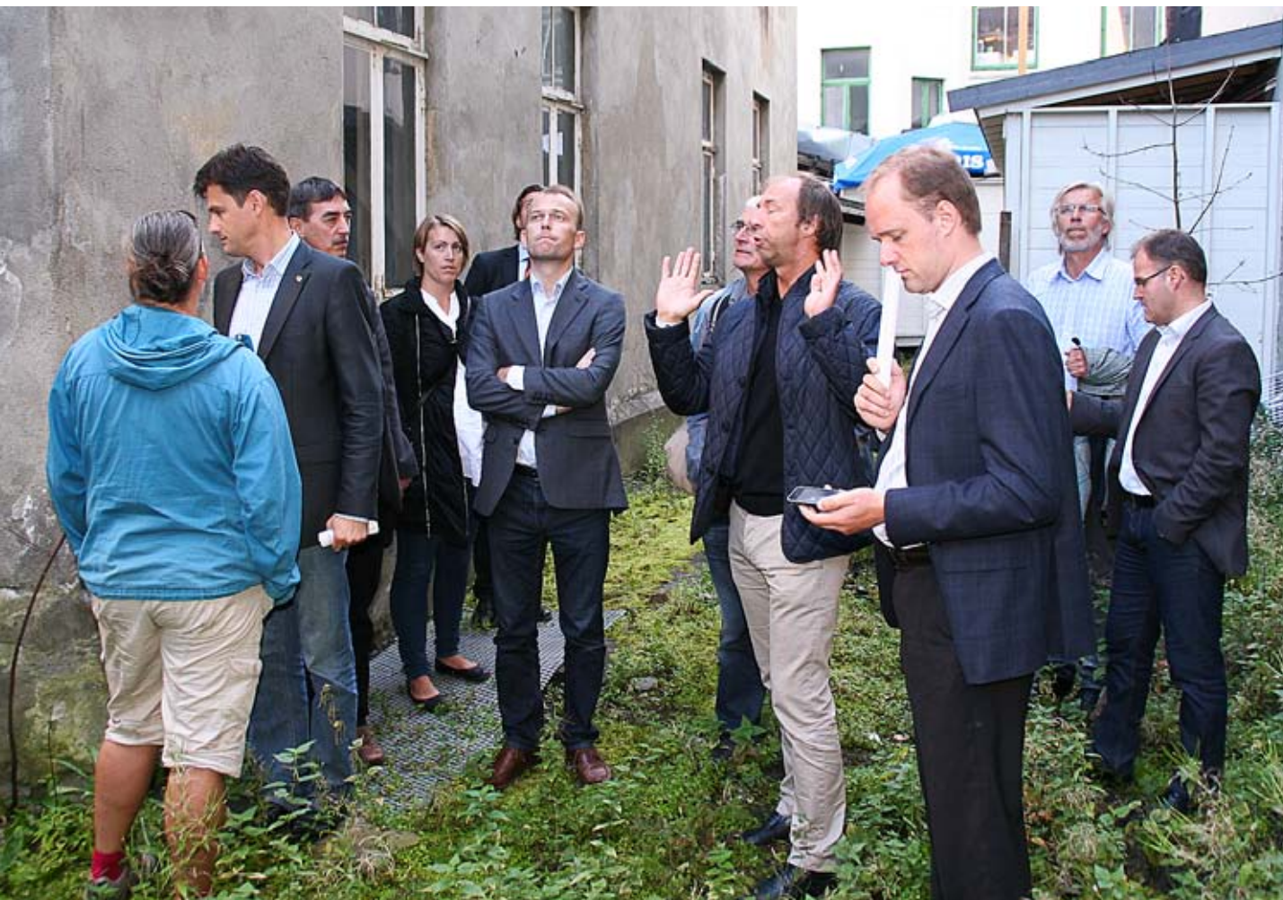
NiT arrangerte byvandring for politikerne før valget 2011. Det gror godt i byens bakgårder. Opprusting til næringsformål krever både politisk vilje og store ressurser fra gårdeierne.

NiT har også i 2011 jobbet videre med ARENA-prosjektene MedITNor og AkvARENA der NiT er prosjekteier. Målet har blant annet vært å få på plass en videre finansiering av prosjektene, noe man nå ser ut til å ha lyktes med. NiT har videre deltatt i arbeidet i Trondheim Helseklynge, i City Management AS og Trondheim Gårdeierforening, og i etableringen av en innflaggingspilot i regi av Access Mid-Norway og Innovasjon Norge.