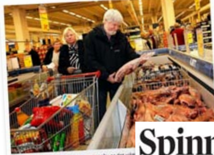
Tøring viltgrøt: Et lønnsomt næringsliv er det viktigste og viktigste, skriver kronikkforfatteren.